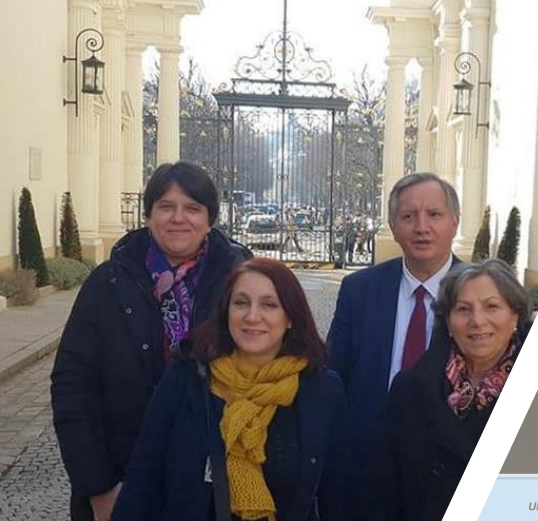
Une salle Mélanie a été créée au commissariat de Bar-le-Duc, pour l'audition des enfants