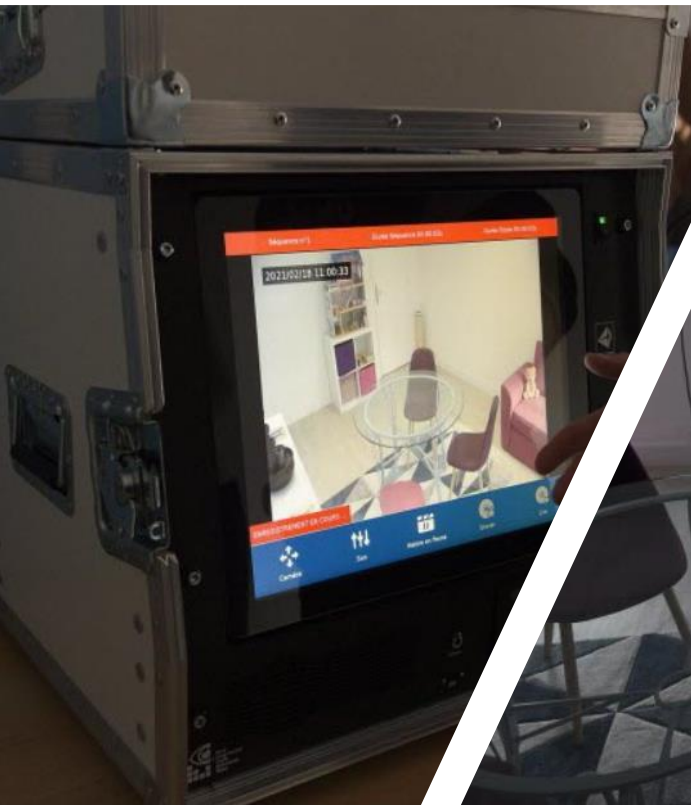
Le système d'enregistrement des auditions