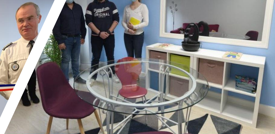
Une salle Mélanie a été créée au commissariat de Bar-le-Duc, pour l'audition des enfants victimes.